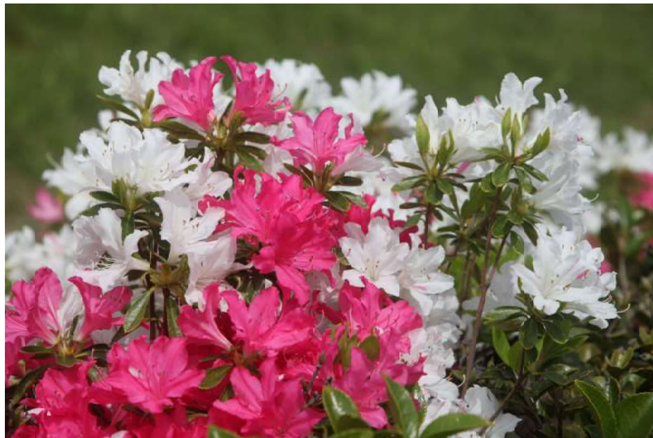
撮影: 「久留米市内 つつじ」