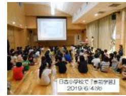
日吉小学校で「事前学習」 2019/6/4(火)