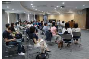
院内ギャラリー 『がんと生きる、わたしの物語』