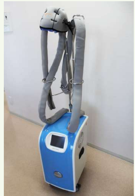
Paxman Scalp Cooling システム Orbis