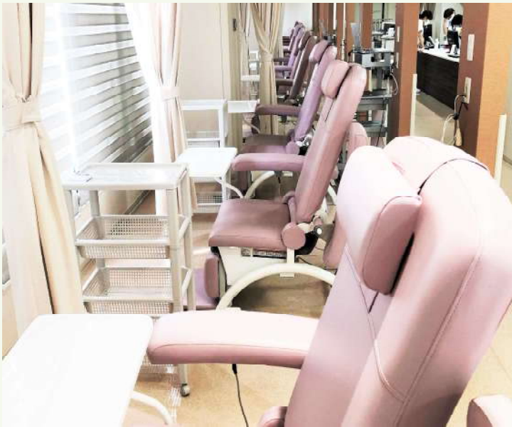
(診療棟 2F 化学療法室内)