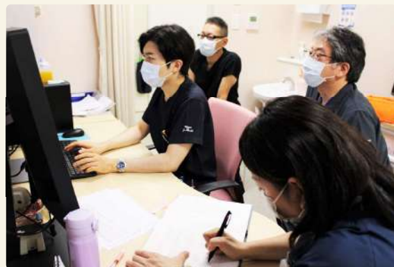
(朝のカンファの様子 常勤医4名)