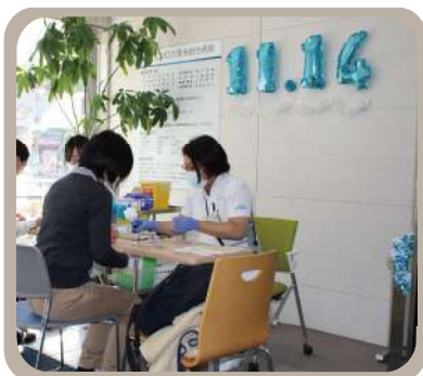
2023年11月14日 世界糖尿病デー 健康フェスティバルの様子