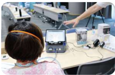
「N95 マスク定量的フィットテスト」

私たちも他施設の現状を知ることができ、そして参加者のみなさまと一緒に学ぶことができた有意義な時間でした。