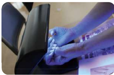
「手洗いチェッカーによる手指衛生」